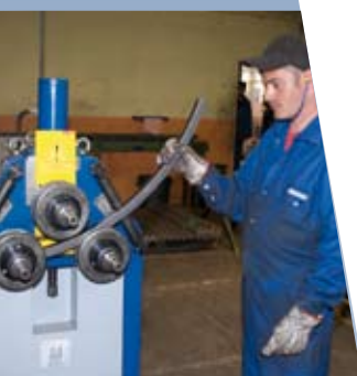
Unité de roulage

L'ensemble de notre production peut être livrée sous forme de pièces simples ou mécano-soudées.