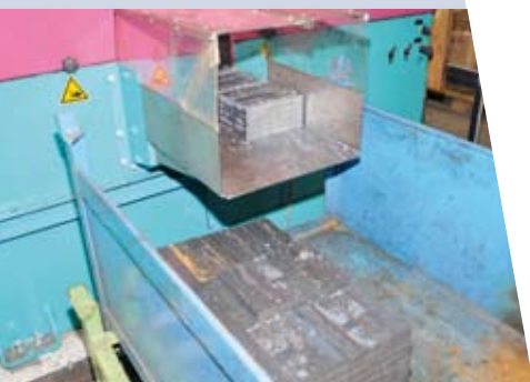
Scie à ruban

Prévus par la loi, la sous-traitance avec les secteurs adaptés et protégés offre aux entreprises de 20 salariés et plus la possibilité de remplir une partie de leur obligation d'emploi de personnes handicapées.